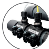
Points d'injection pré-montés