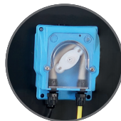
Pompe doseuse pH