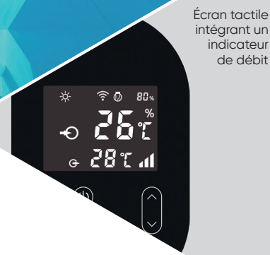
Écran tactile intégrant un indicateur de débit

Fonctionne dès -15 °C dans l'air Carrosserie aluminium Livrée avec housse d'hivernage et silent bloc