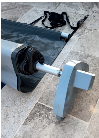
Chariots roulants, compacts et portant la couverture.

Padolo est à utiliser sur des piscines enterrées avec un sol roulant : dur et régulier.