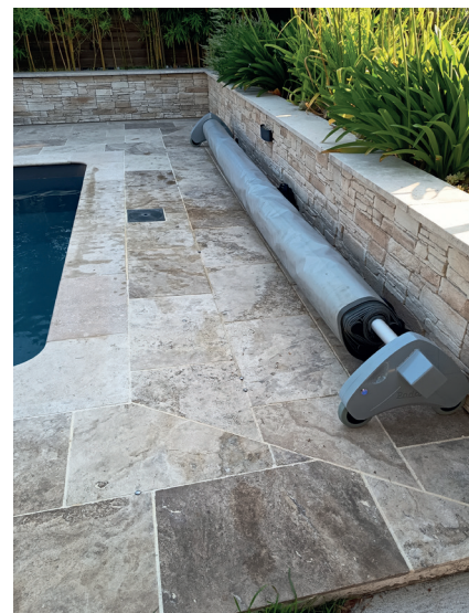
Permet de reculer la couverture et de dégager le bord du bassin.