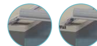
C - Rails à visser sur plage D - Rails encastrés sur plage