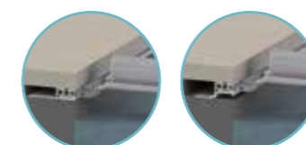
A - Rails plats B - Rails épargne hung