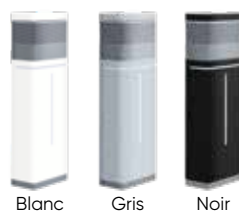
Blanc Gris Noir