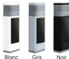
Blanc Gris Noir